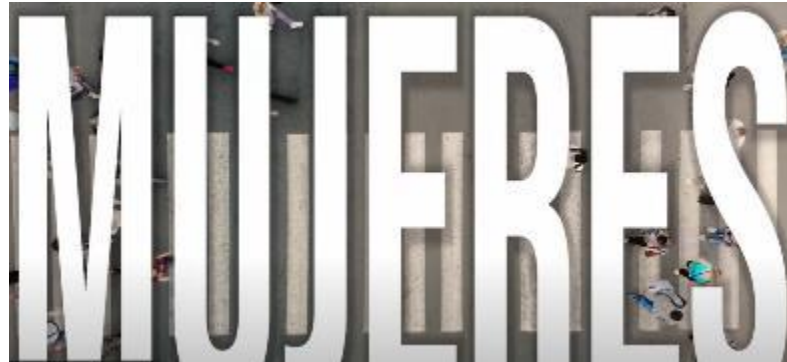
Campaña de vídeo “Mujeres”