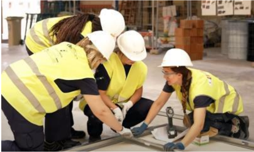
Lignum Tech, FLC y Gobierno de Castilla-La Mancha

Formación: “Operaciones en la fabricación de baños industrializados”